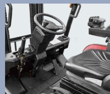
Увеличенная педаль тормоза и функция рекуперативного торможения