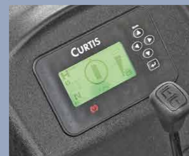
Прибор может синхронно отображать угол поворота и направление поворота